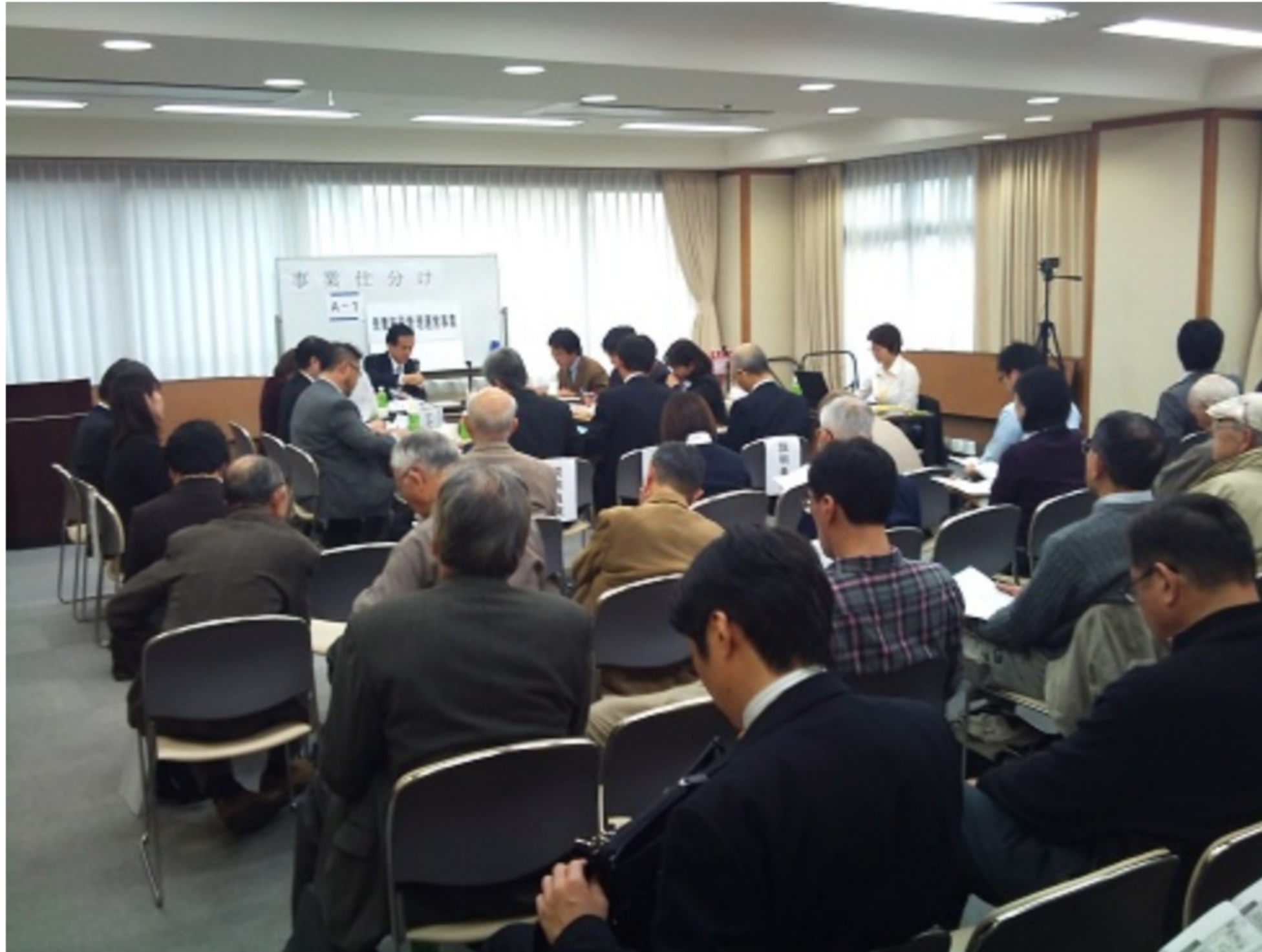
A-1 保養施設管理運営事業【民間】