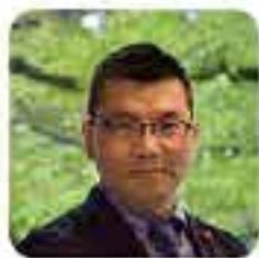
副議長 土井 裕之