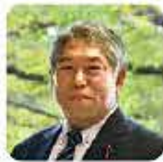
副議長 高柳 俊哉